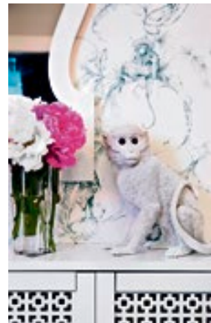
Affen sind zurzeit ein Must.