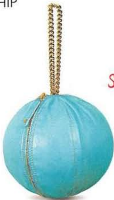
Die Taschen von Bea Bühler gibt es in vier Größen, ab ca. 190 Euro