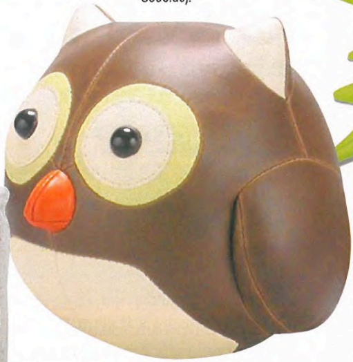
WALDGEIST „Eule Cicci“, Tierfigur, Kunstleder. Züny, ca. 50 Euro (www.design-3000.de).