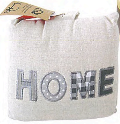
LANDHAUSSTIL Modell „Home“, Aufnäher, Baumwolle. Kunstgewerbe Gehlmann, ca. 10 Euro.

Bisher waren Türstopper eher praktisch statt hübsch. Dabei kann man sich auch ganz stilvoll dazwischendrängeln – wie diese zauberhaften Pieces beweisen.