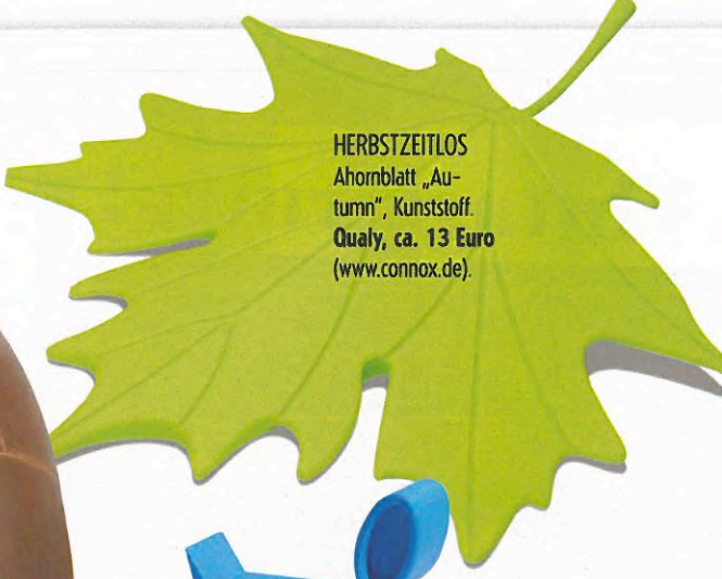
HERBSTZEITLOS Ahornblatt „Autumn“, Kunststoff. Qualy, ca. 13 Euro (www.connox.de).